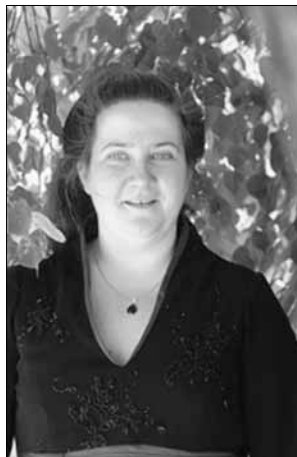
Foto (Susanne Krumbiegel): Susanne Krumbiegel konnte als Solistin für das Weihnachtsoratorium gewonnen werden.

Vielleicht eine gute Möglichkeit sich auf die Adventszeit vorzubereiten.