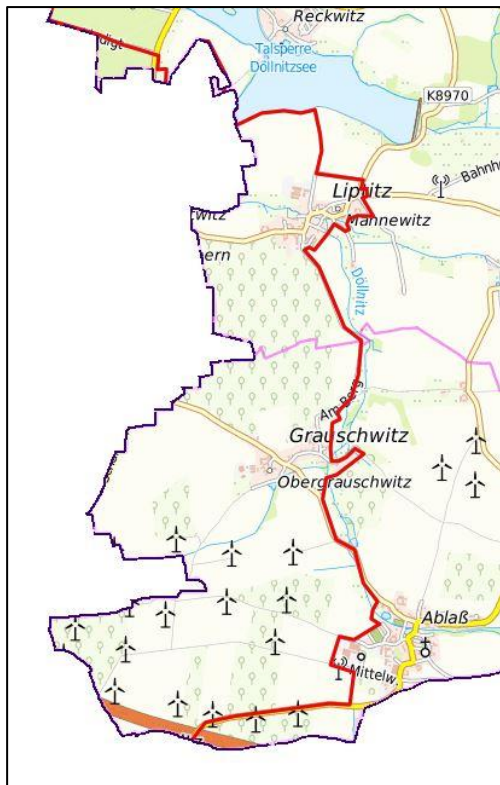
Abbildung 1: Schutzzone