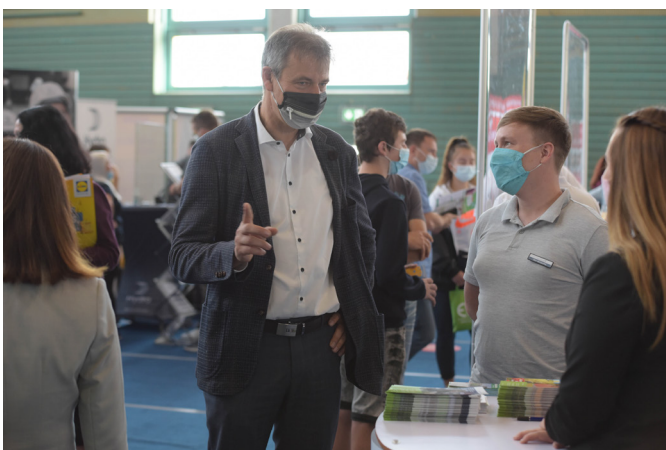
Landrat Kai Emanuel auf der 13. Ausbildungsmesse in Delitzsch.

Ein vermeintlicher Nachteil stellte sich außerdem als Vorteil heraus: Corona-bedingt wurde den Besuchern nur schubweise Eintritt gewährt. Die Aussteller konnten dadurch besser und länger auf die Interessierten eingehen, für die sich das geduldige Warten am Eingang damit umso mehr lohnte.