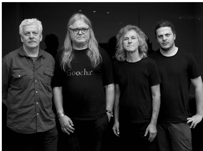
Im Januar kommt die Band „Engerling“ nach Torgau.

Seit 47 Jahren feilt die Ost-Formation beharrlich an ihrem eigenen Stil mit intelligenten Texten im Grenzbereich zwischen Deutschrock und eben doch Blues und hat sich damit ein treues, aber ganz und gar nicht „ostalgisches“ Publikum geschaffen. Das sollte sich nun den 14. Januar dick im Kalender eintragen. Dann gibt es ab 21 Uhr „Rock'n'Blues“ mit Geschichte und dem Blick nach vorn in der Torgauer Kulturbastion zu erleben.