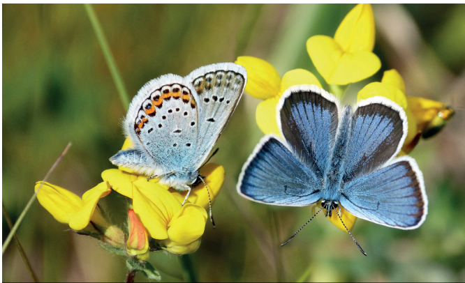
Bläulinge auf Geißklee.

Die Wanderausstellung „Insekten in Gefahr – Ein Rückgang mit Folgen“ des BUND Sachsen (Bund für Umwelt und Naturschutz) macht auf das alarmierende Insektensterben aufmerksam und lädt dazu ein, dessen Ursachen zu erforschen. Auf zehn informativen Roll-Ups wird auf Fragen wie "Warum brauchen wir Insekten?", "Woher kommt der Rückgang der Insekten?" und "Was können wir für den Insektenschutz tun?" eingegangen.